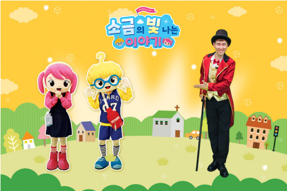
소금의 빛나는 이야기 캐릭터

어떻게 하면 소금처럼 빛처럼 살 수 있을까? 소금과 빛처럼 살고 싶은 어린이 여기 여기 모여라! 재미있고 신나는 이야기 놀이터로 놀러 오세요! 말씀 속으로 쏙 들어가있는 짜로, 폴라라와 함께 키맨이 재미있는 성경 이야기를 들려준대요! 키맨, 짜로, 폴라라가 들려주는 다양한 이야기 속에 소금과 빛처럼 살 수 있는 비밀이 숨어 있어요! 오늘은 어떤 이야기를 들려줄까요?